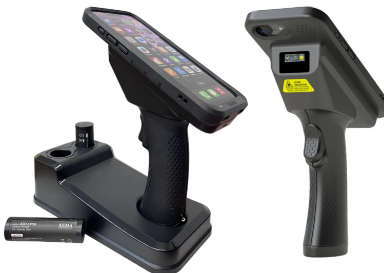
イメージ：X75 と iPhone 16e、クレードル型充電器、バッテリー (iPhone、充電器、追加バッテリーは別売りです)

USB Type-C による直接接続により、安定したデータ転送と iPhone アプリケーションとの即時同期を実現します。これにより、小売・物流現場はもちろん、在庫管理、資産追跡、倉庫業務においても最適なソリューションとなります。